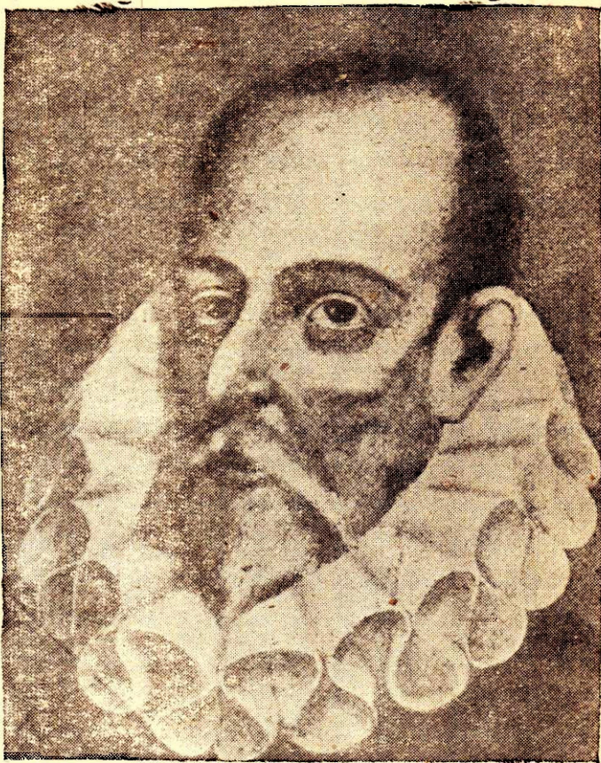
MIGUEL DE CERVANTES SAAVEDRA